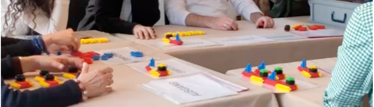
Prozessspiel – Prozessmanagement erleben mit insgesamt über 100 Personen